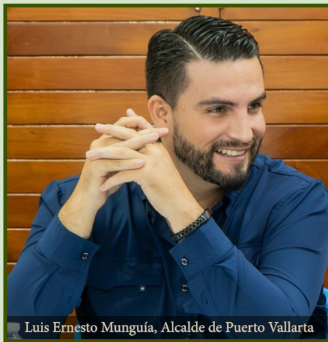
Luis Ernesto Munguía, Alcalde de Puerto Vallarta